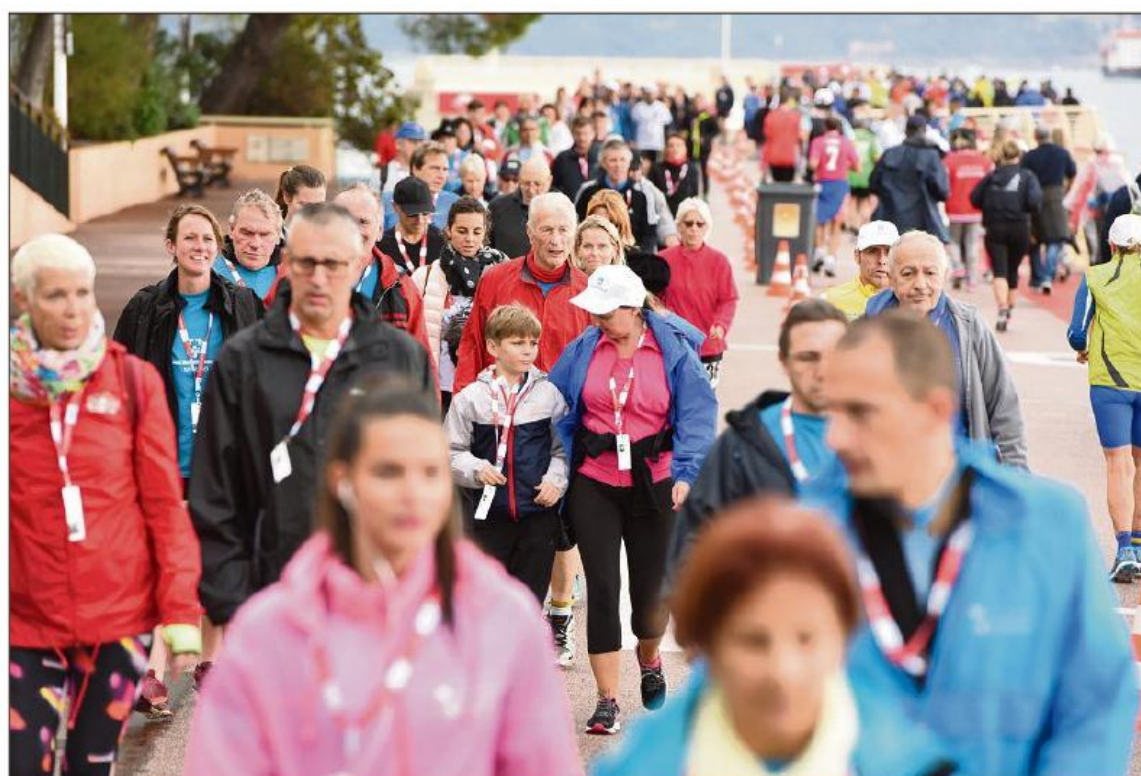
Les caprices de la météo n'ont pas trop troublé l'engagement des sportifs sur le circuit hier.